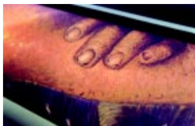
Detalhe durante a impressão: a mídia possui uma camada de canvas com tratamento para ancorar a tinta