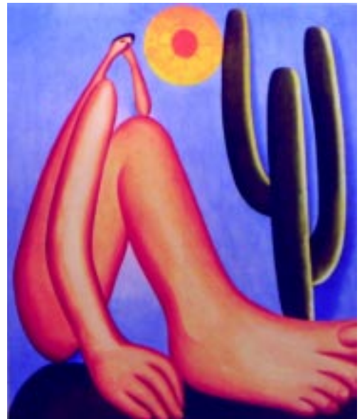
"Abapuru", de Tarsila do Amaral. Quem olha o quadro não imagina que foi produzido com impressão digital

Entre as empresas que lançaram este produto está a Aplike, que desenvolveu o Canvas Jet, material não adesivo, que é feito com uma camada da própria tela, mas com tratamento adequado para receber a